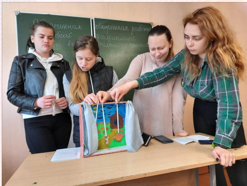
Постановка сказки «Колобок»

Незабываемые постановки кукольного, пальчикового, настольного театров были проведены очень талантливо и смотрелись на одном дыхании. И декорации, и самих кукол девочки делали сами. Хочется поблагодарить педагогов декоративно-прикладных дисциплин, которые дали прекрасные навыки учащимся. К сожалению, я не сфотографировала постановки