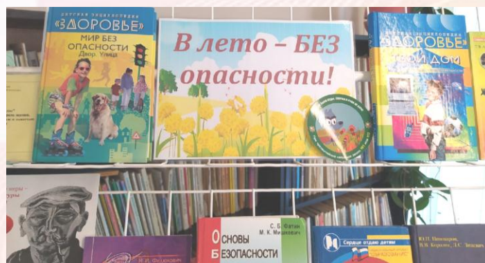
Выставку по безопасности предлагает библиотека колледжа

Как сделать летние каникулы, эту самую самую счастливую пору в жизни каждого учащегося, по-настоящему безопасными? Постарайтесь обсудить с детьми главные вопросы безопасного поведения в местах отдыха, на улицах города, в природных условиях, правила дорожного движения, безопасность на воде, при работе в Интернете, во время селфи, в быту.