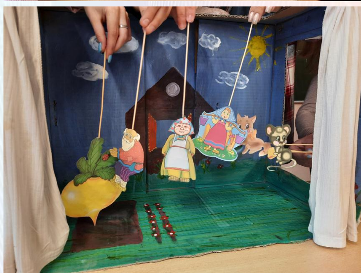
Постановка сказки «Репка»

Профессия воспитателя очень актуальна в современном обществе. Ведь функция воспитателя сейчас – это не банальный присмотр за детьми, а развитие интеллектуальных и творческих способностей ребёнка. От того, какие качества будут сформированы в дошкольном возрасте, зависит и дальнейшее обучение в школе, и формирование жизненной позиции во взрослом возрасте.